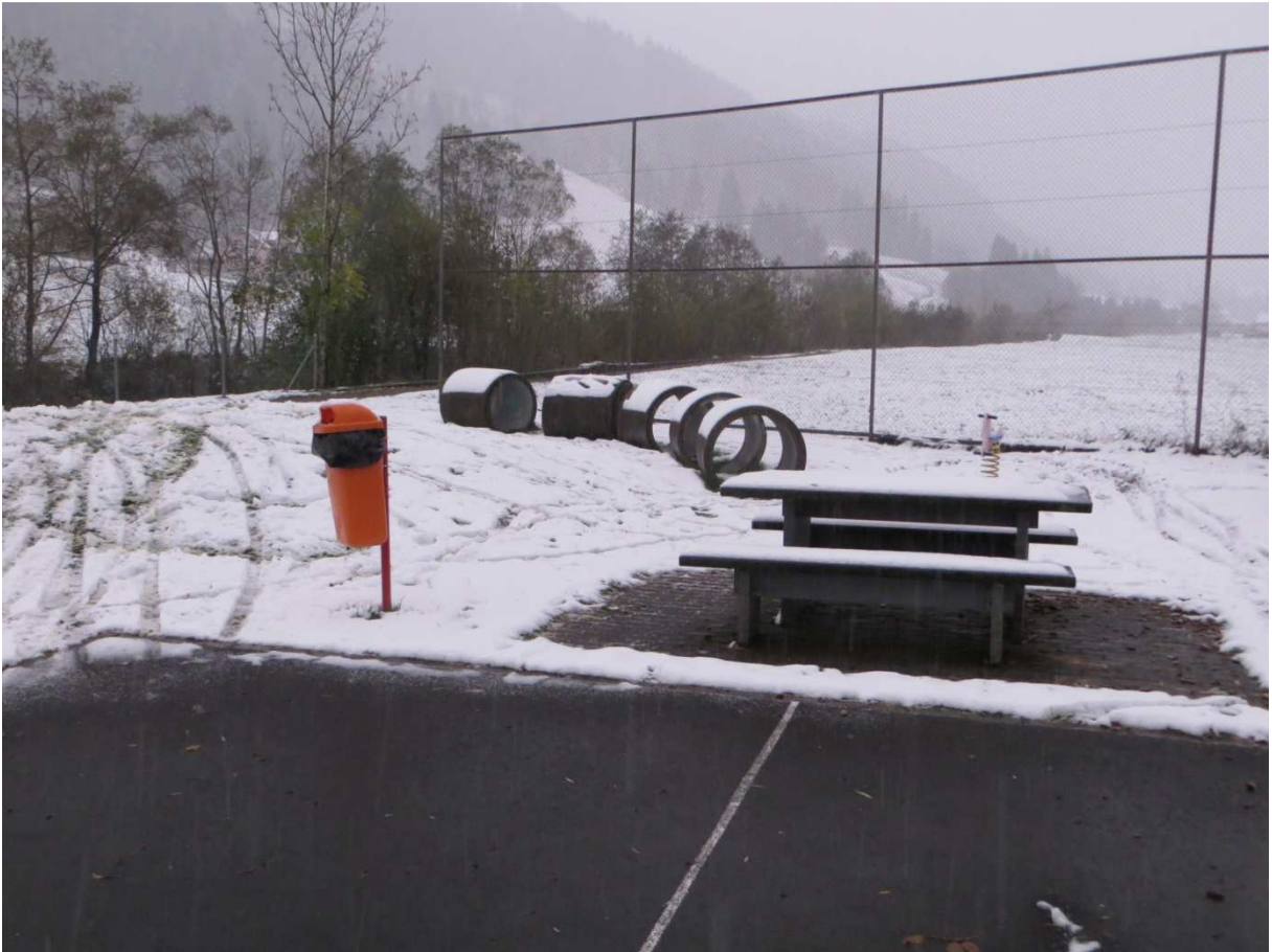
Mittwoch 22. Oktober 2014 18.30 Uhr