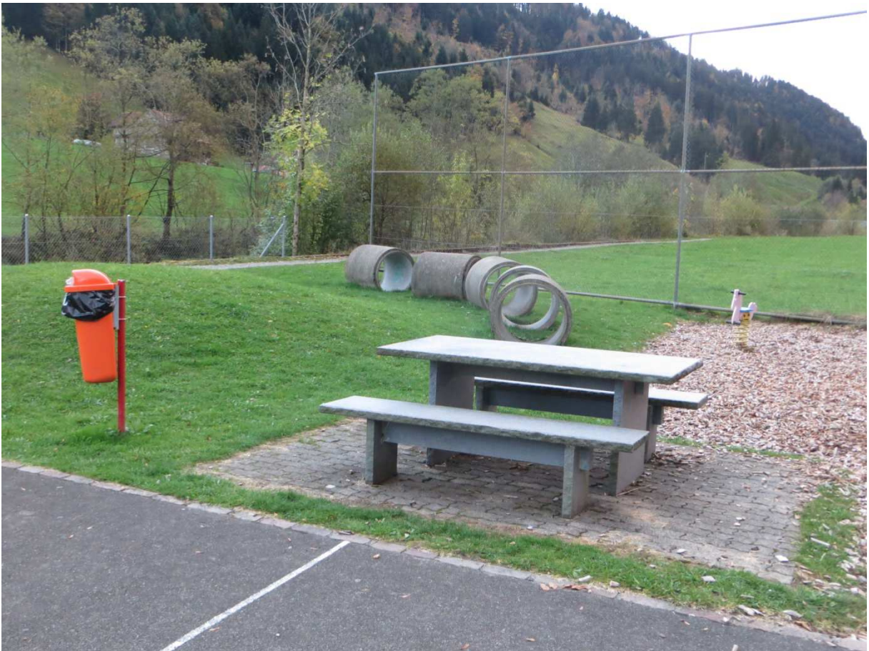
Dienstag 21.Oktober 2014 18.15 Uhr