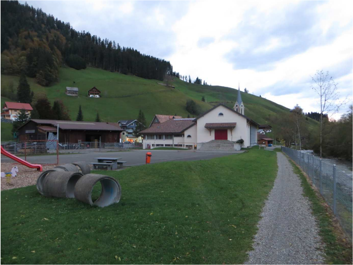
Dienstag 21.Oktober 2014 18.15 Uhr