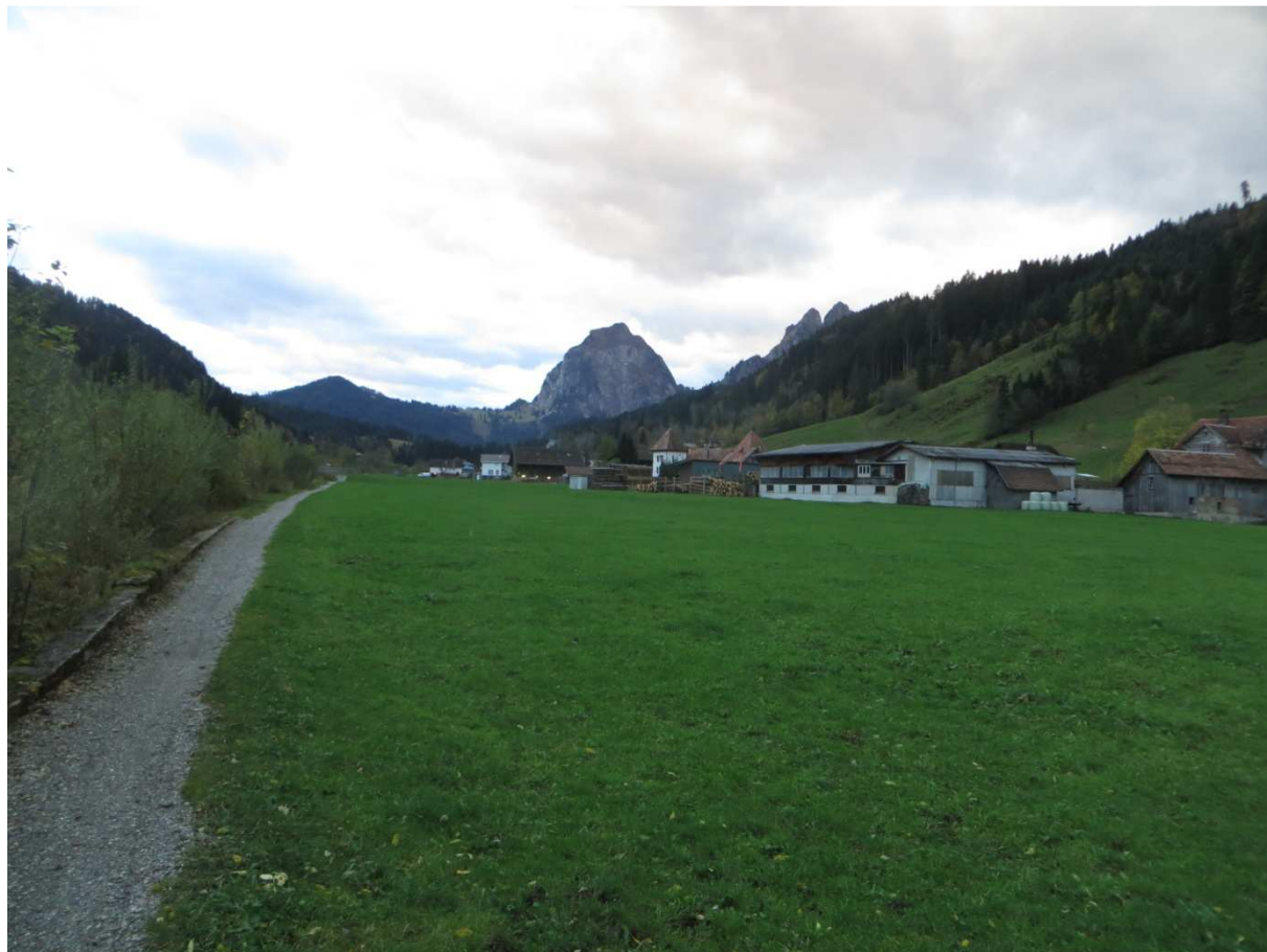
Dienstag 21. Oktober 2014 18.15 Uhr