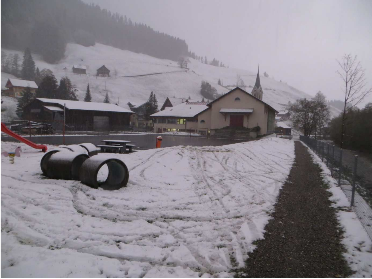
Mittwoch 22. Oktober 2014 18.30 Uhr