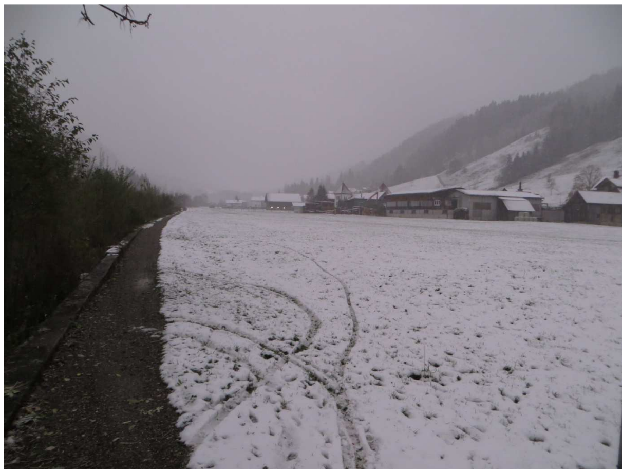
Mittwoch 22. Oktober 2014 18.30 Uhr